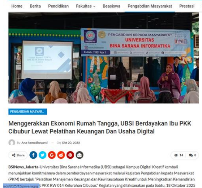
Gambar 5. Publikasi BSI News Online

berdayakan-ibu-pkk-cibubur-lewat-pelatihan-keuangan-dan-usaha-digital/ yang memuat kegiatan pelatihan manajemen keuangan dan kewirausahaan kreatif bagi anggota PKK RW.014 Kelurahan Cibubur. Publikasi ini menjadi sarana diseminasi hasil kegiatan kepada masyarakat luas serta bukti pelaksanaan pengabdian masyarakat yang telah dilakukan.