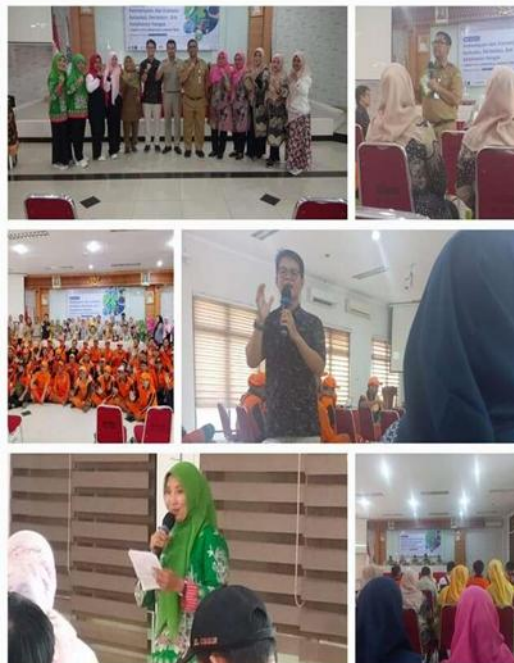
Gambar 4. Kelompok PKK RW 014 Kelurahan Cibubur

Berikut proses penyampaian materi kepada para peserta.