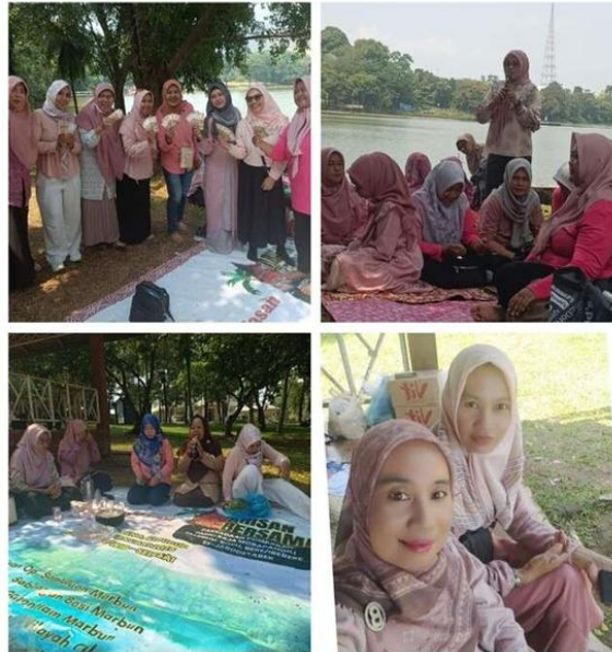
Gambar 2. Kelompok PKK RW.014 Kelurahan Cibubur