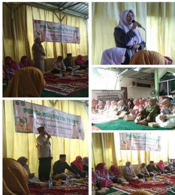
Gambar 1. Kelompok PKK RW.014 Kelurahan Cibubur

Personal branding yang efektif menciptakan gambaran yang jelas dan konsisten tentang siapa Anda sebagai profesional. Ini mencakup bagaimana Anda berkomunikasi, bekerja, dan berinteraksi dengan orang lain. Konsistensi ini membangun kredibilitas dan kepercayaan di mata rekan kerja, atasan, dan klien.