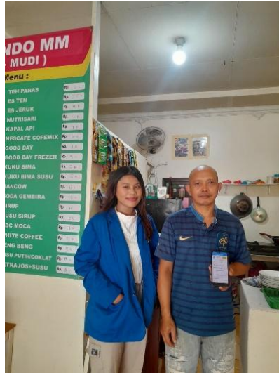
Gambar 2. Dokumentasi Pendampingan UMKM Warmindo Muda Mudi