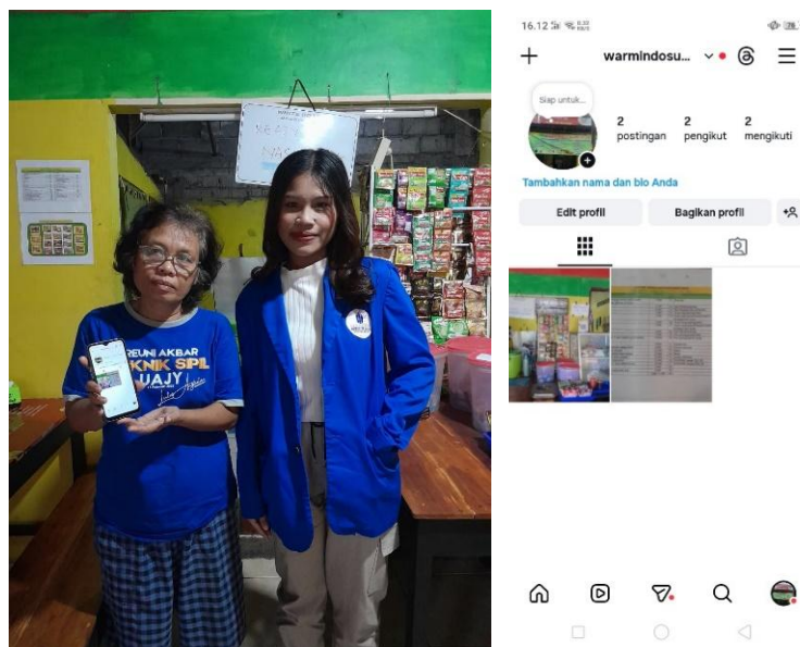
Gambar 1. Dokumentasi Pendampingan pada UMKM Warmindo Sumulur

Kegiatan pengabdian kepada masyarakat yang dilaksanakan dalam bentuk praktik kerja lapangan difokuskan pada pemberian pelatihan pemasaran digital kepada pelaku Usaha Mikro, Kecil, dan Menengah (UMKM) yang sebelumnya belum memiliki pemahaman yang memadai terkait digital marketing. Kegiatan ini dilaksanakan selama satu bulan, yaitu bulan Desember 2025 dengan intensitas sebanyak empat kali pertemuan, yang dirancang secara bertahap dan berkelanjutan. Setiap pertemuan diarahkan untuk meningkatkan pemahaman dan keterampilan peserta dalam memasarkan produk usaha melalui media digital, khususnya media sosial. Melalui pendekatan pelatihan dan pendampingan secara langsung, pelaku UMKM memperoleh pemahaman praktis mengenai strategi pemasaran digital, pembuatan konten promosi, serta pemanfaatan platform digital sebagai sarana memperluas jangkauan pasar. Dengan demikian, kegiatan ini berperan sebagai upaya nyata dalam meningkatkan kapasitas pelaku UMKM agar mampu memasarkan produk secara mandiri dan adaptif terhadap perkembangan era ekonomi digital.