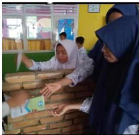
Gambar 3. Membagikan leaflet kepada peserta

Di akhir kegiatan sosialisasi penulis meminta tanggapan dan saran terkait kegiatan kepada peserta sosialisasi. Hal ini perlu dilakukan sebagai momentum bagi siswa untuk menyampaikan aspirasinya agar mereka terhindar dari bullying. Bagi penulis tanggapan dan masukan tersebut dijadikan untuk memperbaiki diri.