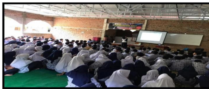
Gambar 2. Foto sosialisasi tentang bullying

Pada tahapan ini pelaksanaan dibagi menjadi dua kegiatan yang terdiri dari sosialisasi dampak bully yang dilaksanakan pada 18 April 2024 dan bimbingan intensif yang dilaksanakan 20 April 2024.