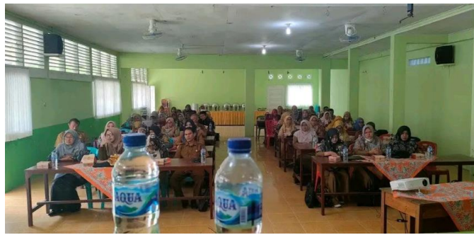
Gambar 4. Pelaksanaan Bimbingan Intensif Tahap I

Kegiatan kelima yaitu bimbingan intensif kepada siswa-siswi yang terlibat kasus bully. Bimbingan intensif dilaksanakan pada 18 April 2024. Bimbingan intensif merupakan cara yang digunakan untuk memberikan pemahaman kepada siswa-siswi tentang dampak dari tindakan bully secara terus menerus. Peserta dari bimbingan intensif terdiri dari 35 siswa yang merupakan perwakilan dari setiap lokal di kelas XI. Bimbingan intensif dilaksanakan di dalam ruangan kelas setelah jam pelajaran selesai yakni pukul 14.45 WIB sampai selesai. Lalu bimbingan intensif juga dilaksanakan di mushola sekolah pada pukul 14.00 WIB sampai selesai.