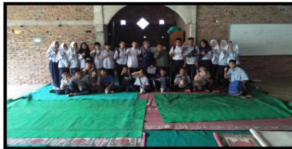
Gambar 7. Pelaksanaan Bimbingan Intensif Tahap IV

Pada bimbingan Tahap III dilaksanakan di mushala sekolah pada 19 April 2024 dengan tema “terbiasa karena biasa”. Pada tahap ini penulis menyampaikan materi yang berkaitan dengan tema dan sesuaikan dengan dampak bully kepada peserta. Penulis memberikan pengetahuan dan pemahaman lanjutan dari sosialisasi tentang dampak bully kepada peserta.