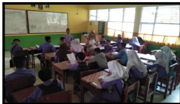
Gambar 5. Pelaksanaan Bimbingan Intensif Tahap II

Bimbingan intensif Tahap I dilaksanakan ruang kelas pada 18 April 2024 dengan tema “Perkenalan”. Pada tahap ini penulis membagikan kertas yang berisi format biodata kepada para peserta bimbingan. Tujuan pengisian biodata yaitu penulis ingin mengenal peserta lebih dekat karena sebelum memberikan bimbingan sebaiknya penulis harus mengenal siswa tersebut. Oleh karena itu, dalam proses pengisian biodata oleh peserta bimbingan, peneliti memandu jalannya kegiatan agar kegiatan sesuai dengan yang direncanakan. Dari 35 guru dan siswa yang dilibatkan pada kegiatan ini hanya 30 siswa yang hadir. Dari 30 siswa tersebut 95 persen diantaranya mengisi lembaran biodata dengan tepat.