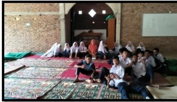
Gambar 6. Pelaksanaan Bimbingan Intensif Tahap III

Tujuan pembinaan tahap II yaitu untuk melihat penyebab siswa-siswi tersebut melakukan bully kepada teman-temannya. Karena bully disebabkan pelaku mengalami permasalahan akibatnya memendam unsur sakit hati, ketidakpuasan, atau balas dendam sehingga membalaskannya kepada teman-temannya. Akibatnya tanpa sadar pelaku sudah berperilaku bully.